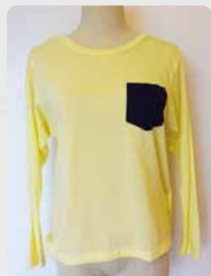
右肩開き(イエロー)