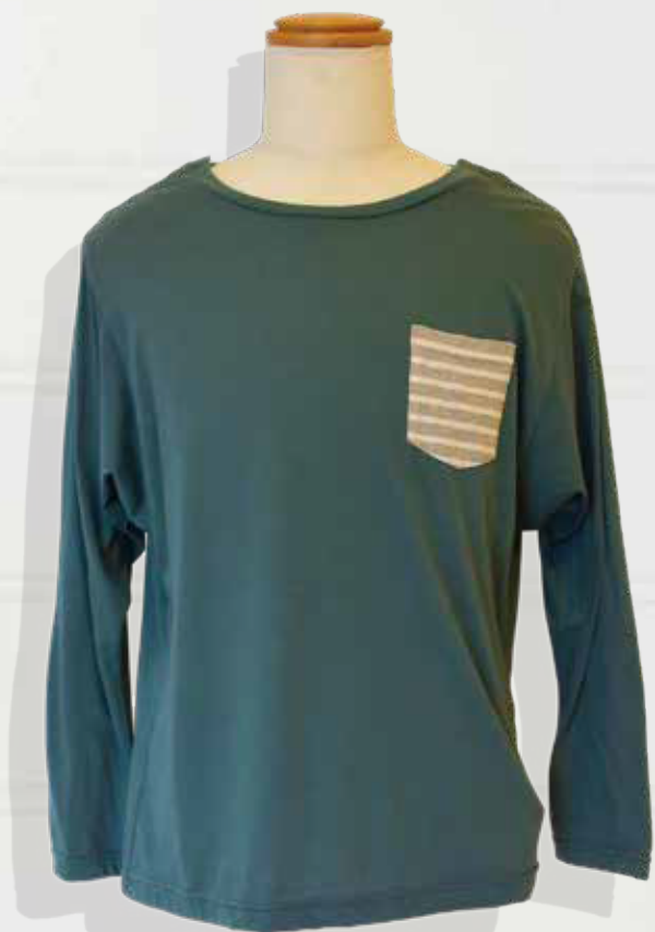
両肩開き(グリーン)

どんな人にも心地よいバリアフリーウェア anyone's possible fashion