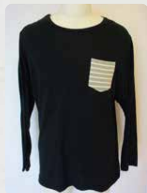
右肩開き(ブラック)

薄手の長袖トップスはあまり出回っておらず、暑い時期の施設内で冷房対策やいつの間にか起きる皮膚剥離事故の緩和に一定の効果が期待できるかと思えます。片麻痺のある方や介助量が多く肩周り等の拘縮が強い方にお奨めです。一方で、販売時には実際本人様方に手に取っていただくと、重ね着をする、インナーとして使うなど肩開き機能に拘らず、自身で用途を考え、自身のニーズに合わせた1着として選んでいただく形が定着しています。cloth tone の処女作です。